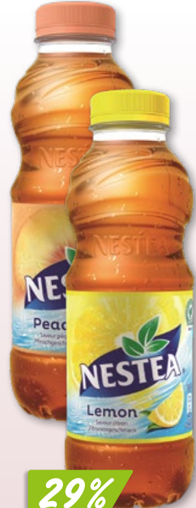
Nestea Lemon oder Peach 24 x