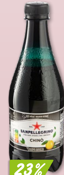
SanPellegrino Aranciata oder Chinotto 6 x 4