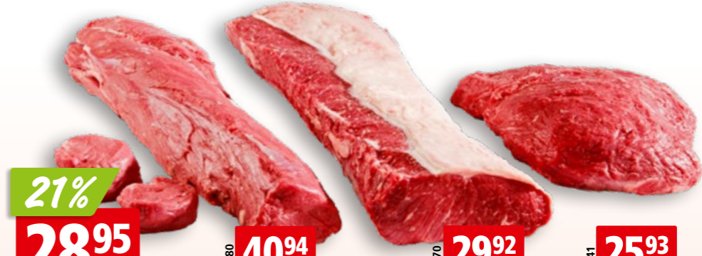
Rinds-Karton assortiert frisch aus Paraguay