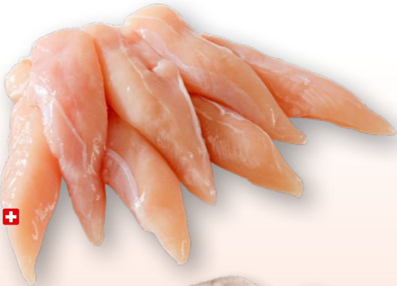
Pouletbrust-Innenfilets frisch , aus der Schweiz ca. 1 kg