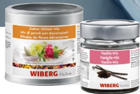
Dekor-Blüten-Mix Flower Power für die Sinne