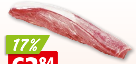
Rindsfilet Mittelstück frisch aus Australien