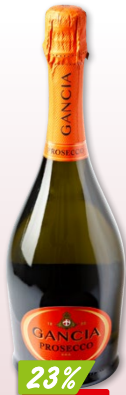
Prosecco Millesimato Toso Veneto DOC, 6 x