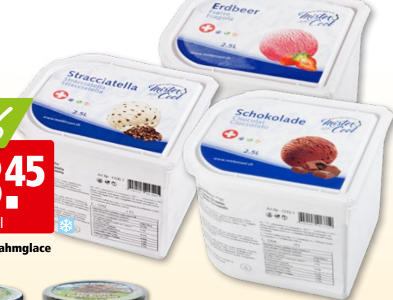
Mister Cool Rahmglace diverse Sorten