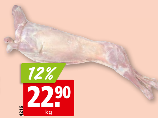
Lamm-Gigot frisch mit Bein, aus Australien/Neuseeland/Irland ca. 2.5 kg (gerollt, ohne Bein: 20.96/kg, 20%)